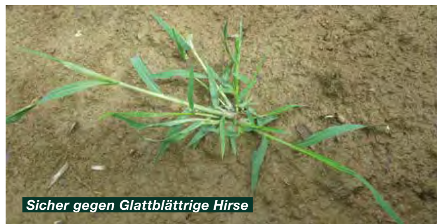
Sicher gegen Glattblättrige Hirse

Die Produktkombination richtet sich an Anwender, die schon in der Vergangenheit gute Erfahrungen mit Laudis + Aspect Pro gemacht haben. Die Produktkombination richtet sich an Anwender, die ein extrem breites Wirkungsspektrum schätzen und auf die Vorzüge von Laudis + Aspect Pro nicht verzichten wollen.