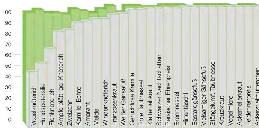
Vergleich: ■ 3x Betanal MaxxPro ■ 3x Betanal MaxxPro + Debut